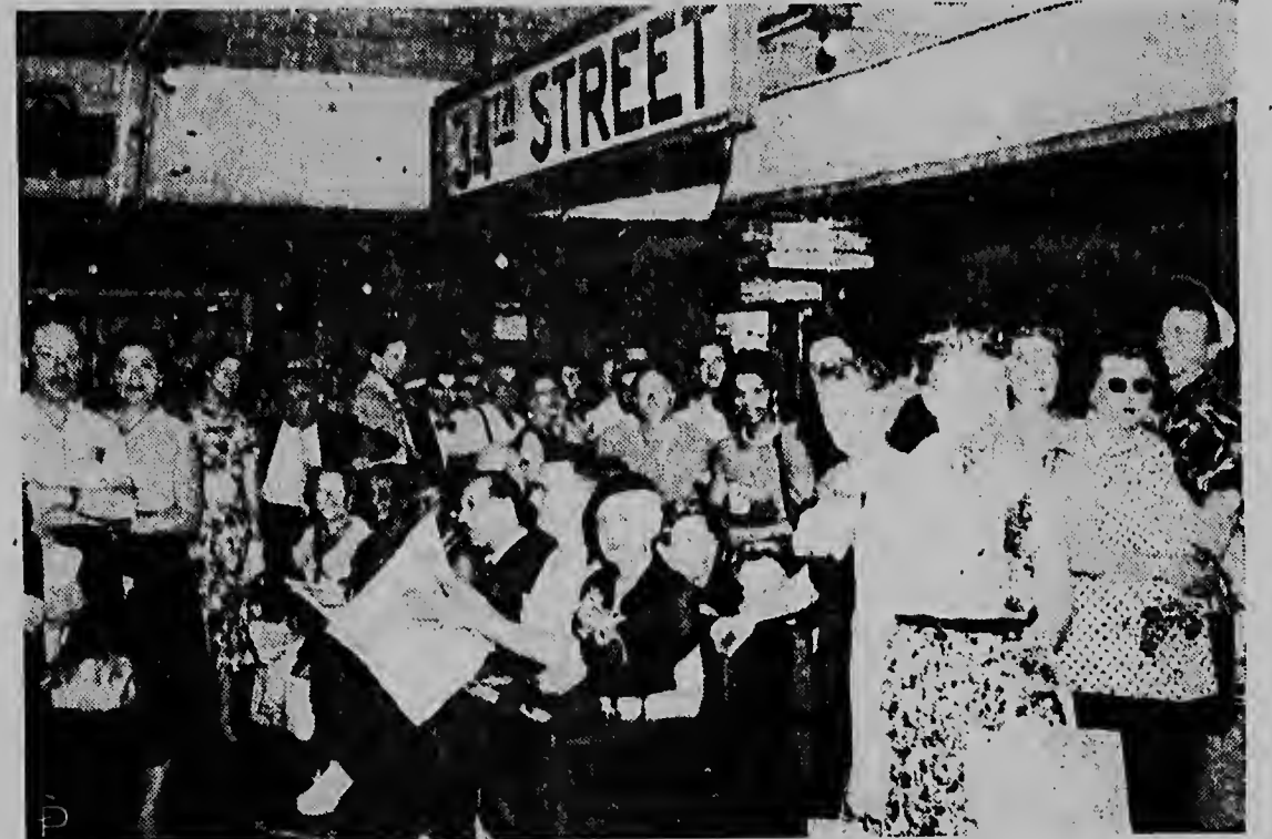
Esaki ta un bisita di con e hendenan na Merca ta para ora nan ta go spera riba trein den subway durante di un strike cu tabatin aya di motormen, door di cual ams o meos 780.000 hende a hanja nan mes sin por bai ni bini.